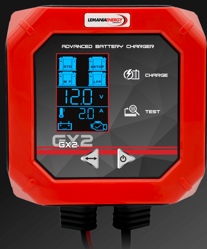
GX2 12V 2.0A