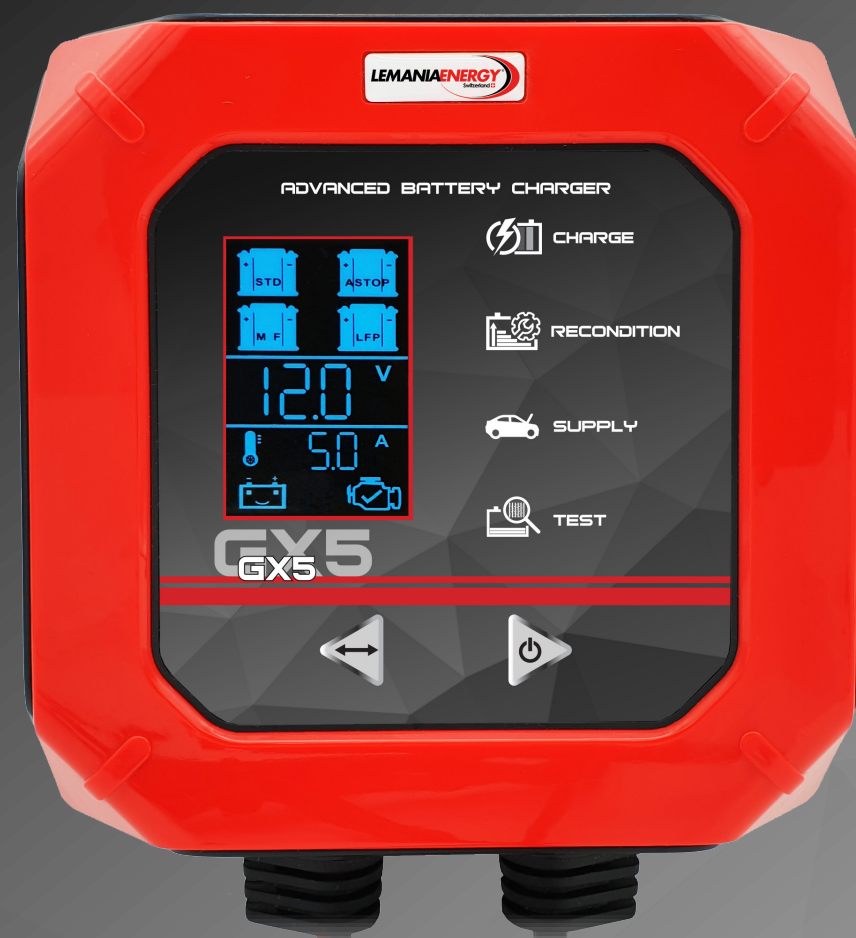
GX5 12V 5.0A