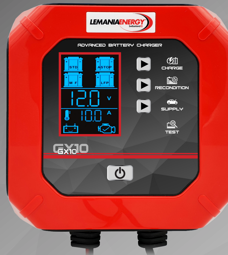
GX10 12V 10.0A