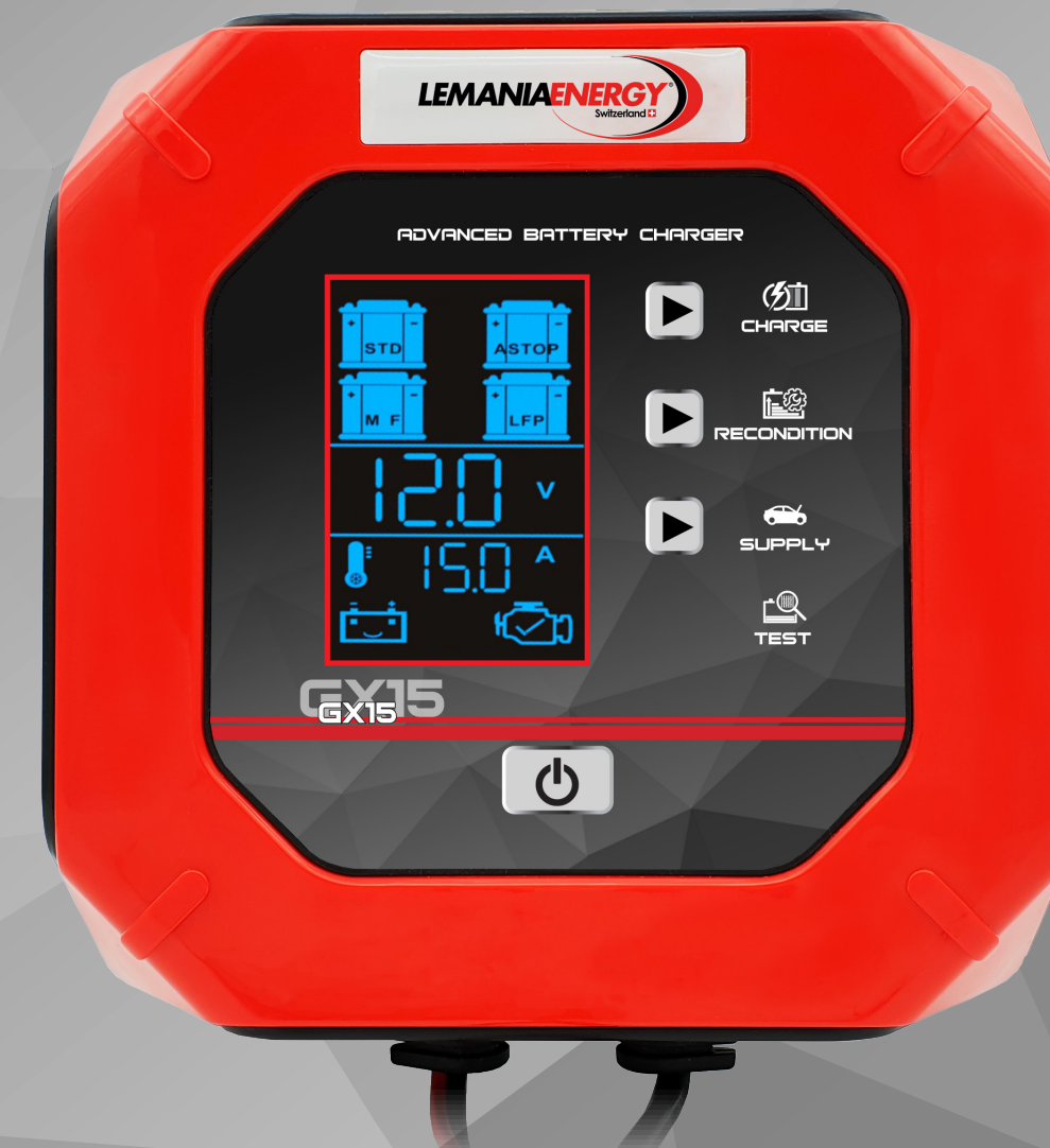
GX15 12/24V 15.0A

The GX is the Ultimate Battery Charging, support and Diagnostic Tool. Combine intelligent charging, maintenance, supply, reconditioning and testing into one simple process with this easy to use Advanced Battery Charger.